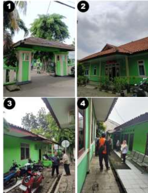
Gambar 4 Kondisi Dalam Tapak Eksisting

Dari hasil pengamatan dilapangan kondisi dalam tapak eksisting sebagai berikut :