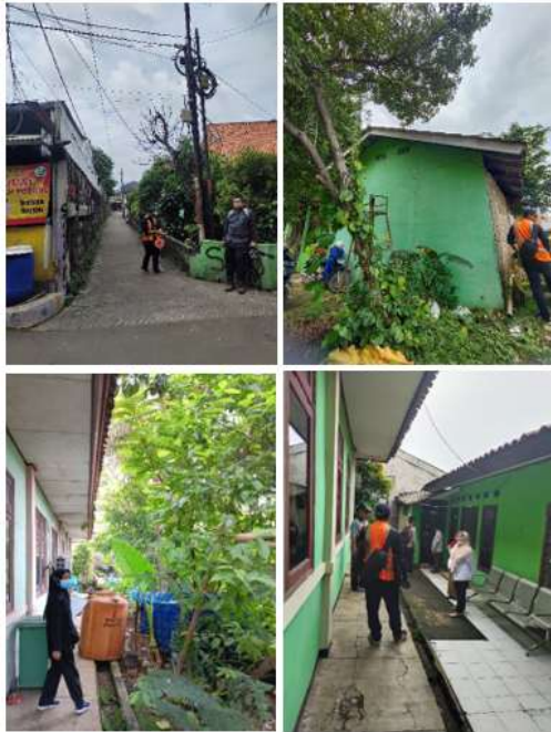
Gambar 2 Pengukuran Luasan Lahan dan Batasan Lahan Eksisting

Dari hasil pengamatan dilapangan kondisi luar tapak eksisting sebagai berikut :