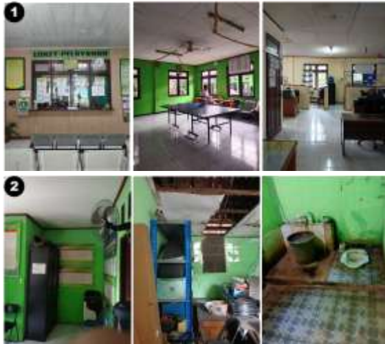
Gambar 5 Kondisi Dalam Bangunan Eksisting

Dari hasil pengamatan dilapangan kondisi dalam bangunan eksisting sebagai berikut :