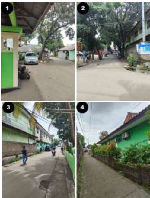
Gambar 3 Kondisi Luar Tapak Eksisting